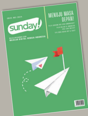
Ilustrasi cover oleh CreativeValuation